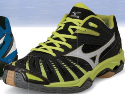
Wave Stealth 2