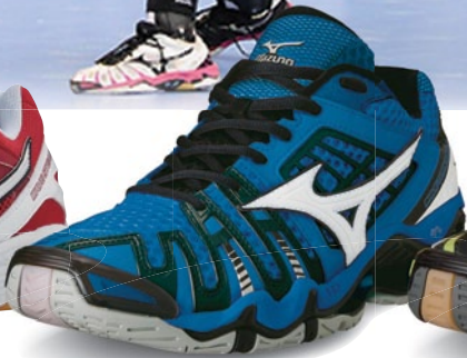
Wave Tornado 8