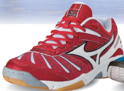
Wave Steam 2